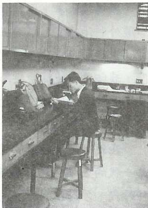
醫院舊牙科技工室